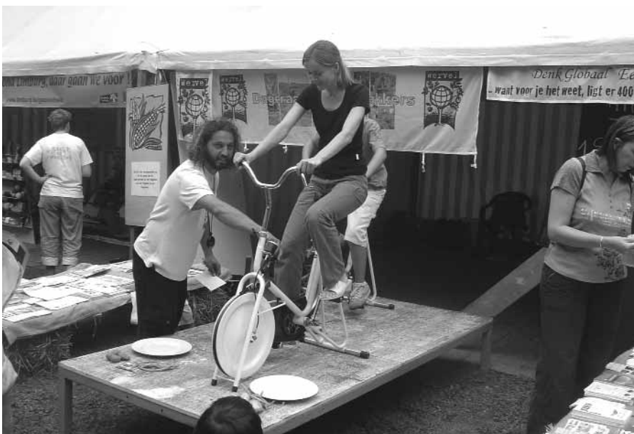
participatieve Wervelstand op Wereldfeest. 20.000 deelnemers op 26 augustus in Bokrijk.

Om Wervels 'Denk globaal, eet lokaal'-verhaal te kaderen, moet je vooral ons sojaverhaal meenemen. Daarom is voor beide campagnes de aangroeiende lijst van sojavrije zuivel en sojavrij vlees zo belangrijk. Misschien moet daar ook maar