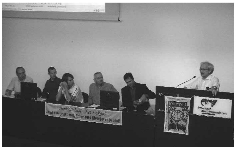
sprekers op de studiedag Landbouw en energiegewassen in Gent

De vzw Biogas-E streeft naar een maximale benutting van het biogaspotentieel in Vlaanderen en daarom worden verschillende initiatieven m.b.t. anaërobie vergisting begeleid. Opvallend is dat de biogas-opbrengst erg verschillend is naargelang de inputstroom. Mest levert gemiddeld 30 ton m 3 /gas per ton vers materiaal. Bij energiegewassen varieert het van 100 tot 200 m 3 /gas per ton inputmateriaal. De hoogste opbrengsten vinden we bij afvalproducten zoals vet van slachthuizen, glycerine, bakafval, ... Die opbrengsten kunnen oplopen van 500 tot zelfs 800 m 3 gas per ton inputmateriaal. Momenteel zijn in Vlaanderen 11 vergistinginstallaties in werking die een gezamenlijk vermogen van 12,26 MWe leveren, ongeveer het energieverbruik van 25.000 gezinnen.