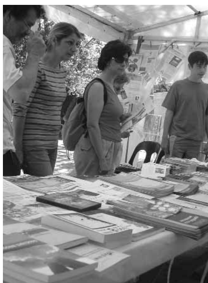
stand 17 jaar Wervel op 20 jaar geitenboerderij Reigershof