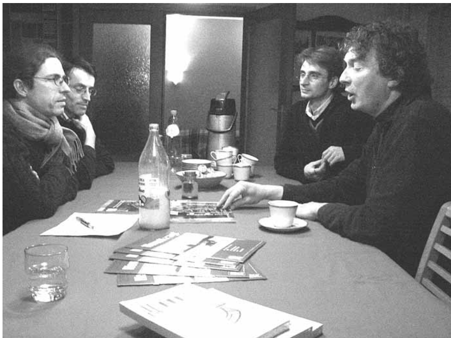
Basisgroep Vlaams-Brabant in vergadering

Een basisgroep van Wervel in Limburg? Tja, waarom is die nodig? Eigenlijk zit de bestaansreden van Wervel, in Limburg of elders, vevat in de naam: ijveren voor een rechtvaardige en verantwoorde landbouw, die moet instaan voor één van de primaire en levensnoodzakelijke behoeften van de mens en dat dient te doen op een ecologisch duurzame en sociaal rechtvaardige manier. Wervel kan het cement, de zuurdesem vormen tussen alle organisaties, instanties, bewegingen en mensen die deze doelstelling trachten in de praktijk te brengen. Cement en zuurdesem zijn nodig om verbindingen tot stand te brengen, om een basis, een draagvlak uit te bouwen voor een meer rechtvaardige landbouw die de belangen van de (kleine) boeren hier én in het Zuiden dient en zo tegelijkertijd een meerwaarde betekent voor het platteland en de natuurlijke omgeving. Bijna geen enkele andere activiteit heeft zoveel raakvlakken met en impact op