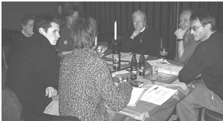
Basisgroep Antwerpen in vergadering

Basisgroepen versterken de banden tussen boer, consument, milieu en derde wereld door persoonlijke contacten op een zo lokaal mogelijk niveau. Enerzijds hebben ze oog en oor voor wat er leeft in de regio en anderzijds vertalen ze de thema's van het gemeenschappelijke jaar- en actieplan van Wervel naar plaatselijke toestanden. Ze organiseren lokale acties, verspreiden campagne-materiaal, verzorgen standen op beurzen en markten, infoavonden, organiseren "boerentoeeren" (bezoeken aan landbouwbedrijven), verzamelen adressen van mogelijke wervelkrant abonnementen, nieuwe donateurs, enzovoort.